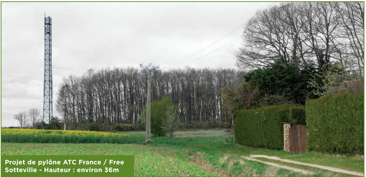
Projet de pylône ATC France / Free Sotteville - Hauteur : environ 36m